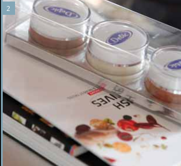
Dave De Belder - foto 12

Kookwonder Dave De Belder van de Godevaart (Antwerpen) herwerkte een deconstructie van de klassieke appeltaart tot een stijlvol dessert.